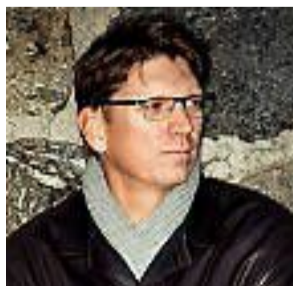
GRÖNT ÄR SKÖNT. Niklas Zennström fortsätter att dela ut sitt klimatpris.

”När vi skapade Green Mentorship Award ville vi rikta fokus mot ett problem, men också mot alla lösningar som redan finns i dag. Jag är nöjd med att se att det finns ett antal entreprenörer som har